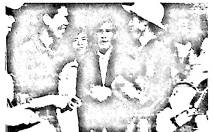
Un grup de civils conversa amb els soldats de l'Exèrcit d'Alliberament, després de la conquesta de Hue.

La llibertat de Viet-Nam i de Cambodja està propera. És un triomf per a tots els pobles del món i tots hem de posar el nostre esforç per garantir la llibertat i la pau a Indoxina.