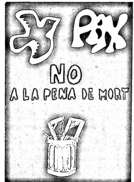
Portada del butlletí interior de PAX Christi, de març 1975.

El cas Puig Antich va demostrar als més escèptics que el franquisme és capaç de matar. Quan el crim està consumat, ja no hi ha remei. PREVINIEM ELS FETS, NO ESTALVIEM ESPORCS PER IMPEDIR NOVES EXECUCIONS, NOUS CRIMS "LEGALS"!